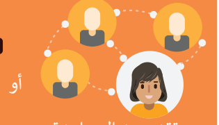
أو تقديم يد المساعدة لأشخاص عاديين

هناك الكثير من الجمعيات التي تبحث باستمرار عن متطوعين جُدد