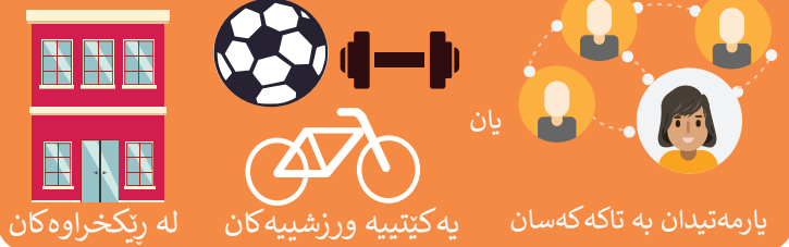
له رێکخراوه‌کان یارمه‌تیدان به‌ تاکه‌که‌سان یان یه‌ کێتییه‌ ورزشیه‌کان

کاری خۆبه‌خشانه له زۆر شوێن ده‌کرێ، بۆ نمونه