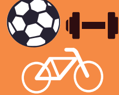
في النوادي الرياضية